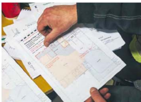
Butikerna kommer att få flytta på sig i omgångar, för att arbetet med utbyggnaden ska gå smidigt.