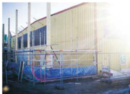
I höst väntas förvandlingen av Handelshus 1 att vara färdig.